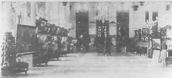
Un aspecto de la Exposición Cugat en el salón de Fiestas de la Asociación de Dependientes.

Publicamos una instantánea de una de esas luchas que están atrayendo tanta concurrencia, y que se efectúan en Payret interín llega Pubillones a ocupar el sitio que ahora ocupan las señoritas luchadoras para demostrar que la mujer, cuan-