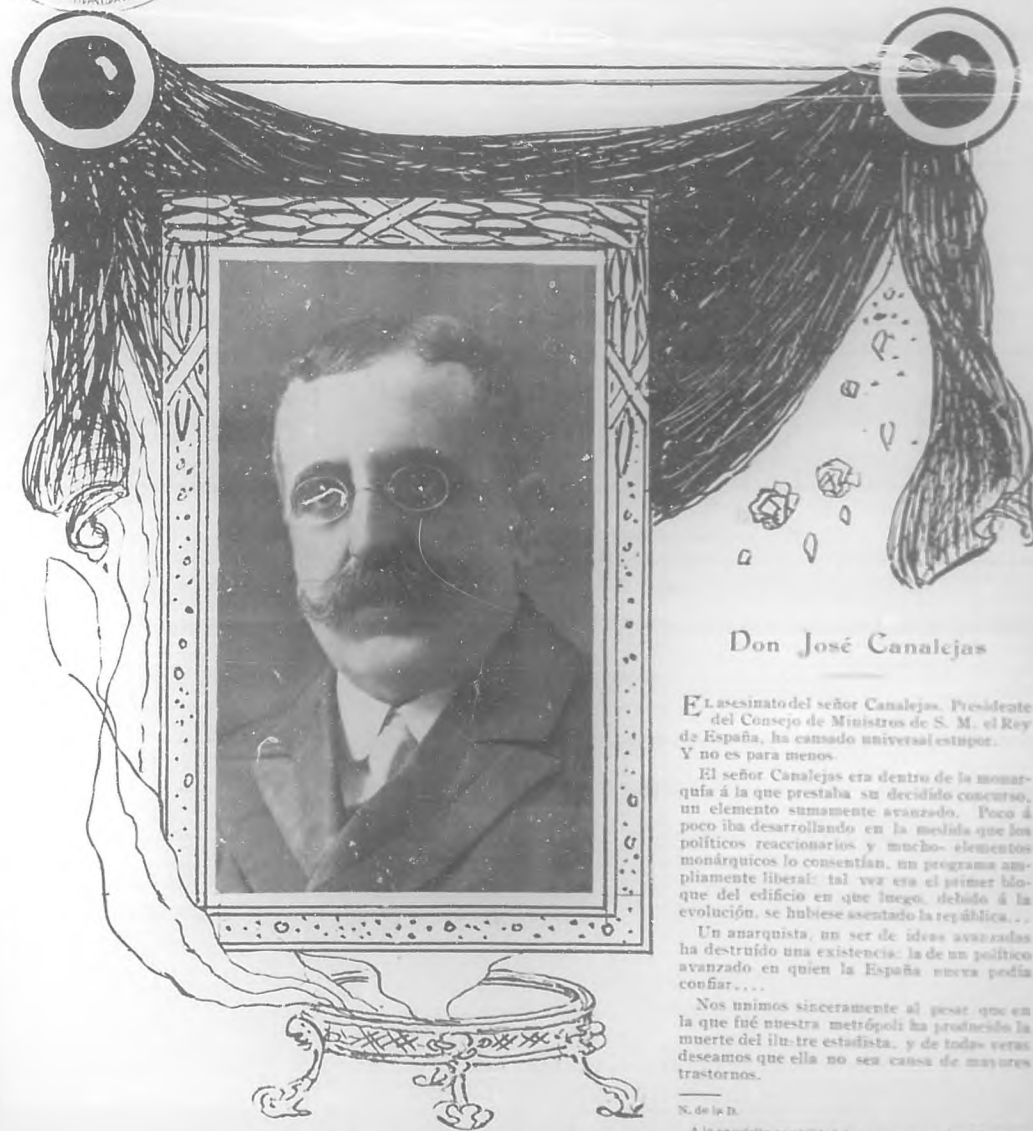
Don José Canalejas