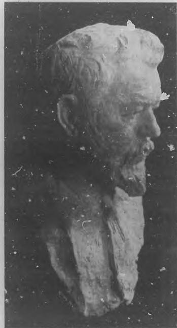
El famoso pintor español Sorolla. (Busto de Villar).