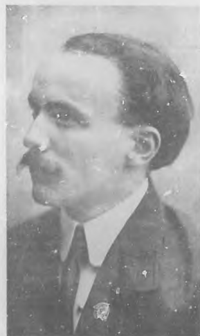
Ambrosio R. Villar, notable escultor español, actualmente en la Habana.

ENCUÉNTRASE en la Habana un escultor notable, trabajador infatigable cuya producción se halla esparcida por distintos países del mundo y de cuya obra en la Habana quedará un valioso recuerdo en el templo de Neptuno y Aguila, en donde está esculpiendo el altar y restablo "Santísima Trinidad", notable alegoría rodeada por cuatro estatuas.