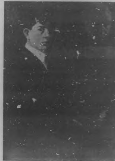
Exposición Cugat.—Busto retratado por el Sr. Villar.

Ciertos rumores acerca del desdicho de que se ha hecho alarde en la interpretación de ciertas obras han contribuido á que parte de la sociedad que da brillo á los espectáculos se haya retraído del Nacional.