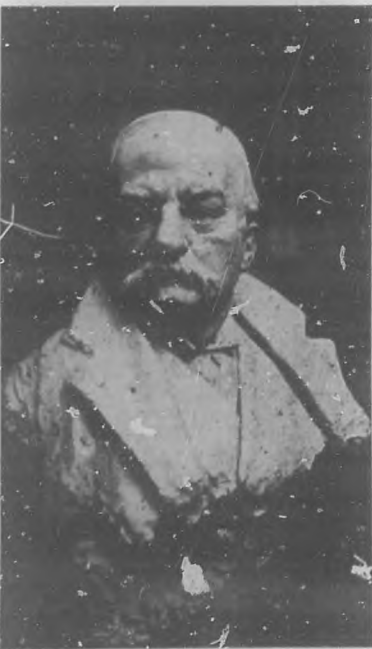
Pierpont Morgan (Busto de Villar).