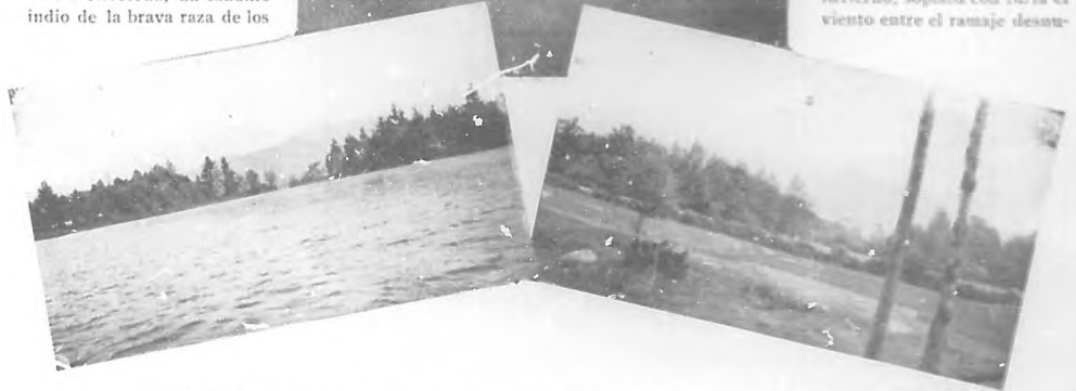
CHOCÓRUA — De izquierda á derecha: —El pico de Chocórua desde el lago —"Chocórua Inn". —El pico visto desde el hotel.

Abenagui, que habiendo perdido á su dulce compañera, cifraba todo su cariño en el tierno hijo que aquella le dejara. Cuando derrotados en la batalla de Lorewell, los indios Pequanoket,—de cuya tribu eran una rama los Abenagui—se retiraron al Canadá, el caudillo Chocórua prefirió vivir con los conquistadores antes que abandonar el hogar de sus antepasados. Junto á su choza se estableció un europeo apellidado Campbell, que habiendo sido señalado partidario de Cromwell, se vió forzado á huir de Inglaterra al restaurarse allí la dinastía de los Estuardo. Con este Champbell hizo tan estrecha amistad Chocórua, que cuando algunos años más tarde se vió obligado á emprender un viaje al Canadá para visitar al resto de su familia emigrada en aquella tierra, no dudó un momento en confiar su hijo, entonces ya un gallardo mozo en quien